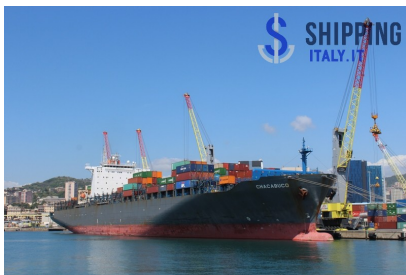
Il Genoa Port Terminal di Spinelli a Genova