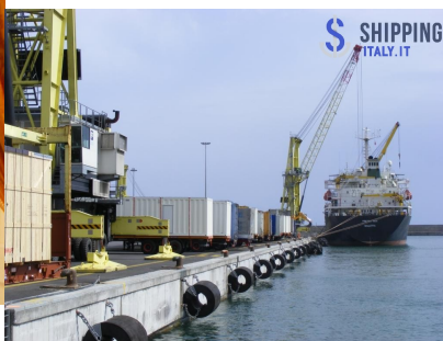
Il Genoa Port Terminal di Spinelli a Genova