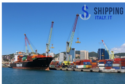
Il Genoa Port Terminal di Spinelli a Genova